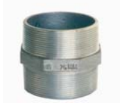
"X01" HEX NIPPLE