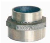
"X02" REDUCING NIPPLE