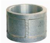
"X04" REDUCING SOCKET