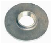
"X23" SCREWED FLANGE